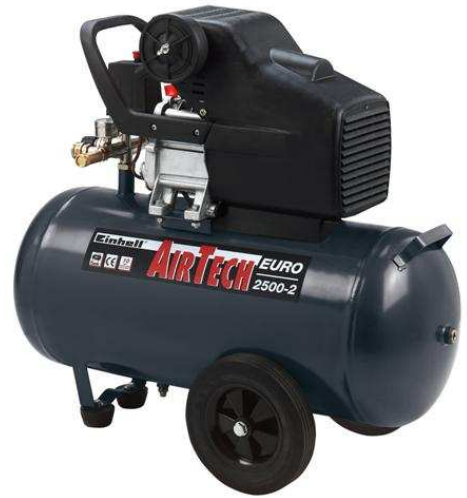
Art.40.101.10 EURO 2500-2

230V-50Hz 1,5KW/2KS 210L/min 24L 2850 min 8 bara 31,3 Kg 60x28,5x63,5 cm