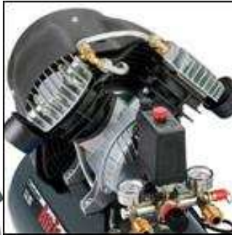
Art.40.073.20 EURO 4300 V

Napon 230V/50 Hz Kapacitet usisa 412L/min Zapremina spremnika: 50L Maks.radni pritisak: 8 bara Snaga motora: 2,2 KW/3KS Težina: 47 Kg Dimenzije pakovanja: 770x330x730 mm