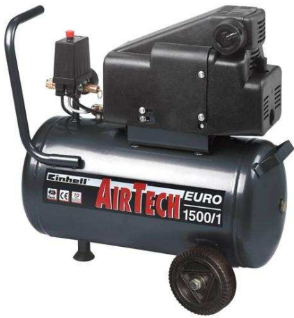
Art.40.100.50 EURO 1500/1

Napon 230V-50Hz Snaga motora 1,1KW/1,5 KS Kapacitet usisa 154L/min Zapremina spremnika: 24L Broj obrtaja: 2850 min Maks.radni pritisak: 8 bara Težina: 22Kg Dimenz.pakovanja: 58x26x58 cm