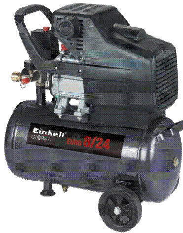
Art. 40.072.50 EURO 8/24 GLOBAL

Napon 230V-50Hz Snaga motora 1,1KW/1,5 KS Kapacitet usisa 154L/min Zapremina spremnika: 24L Broj obrtaja: 2850 min Maks.radni pritisak: 8 bara Težina: 22Kg Dimenz.pakovanja: 58x26x58 cm